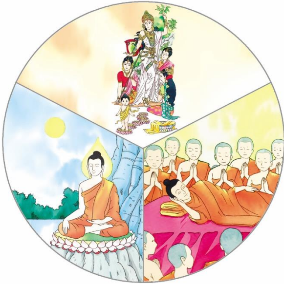
ภาพการประสูติ ตรัสรู้ และปรินิพพานของพระพุทธเจ้า